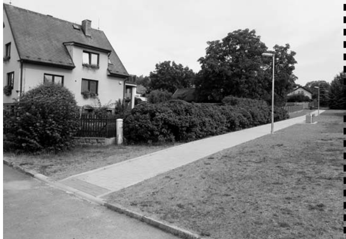
♦ V měsíci srpnu byla dokončena výstavba chodníku v ulici Široká.