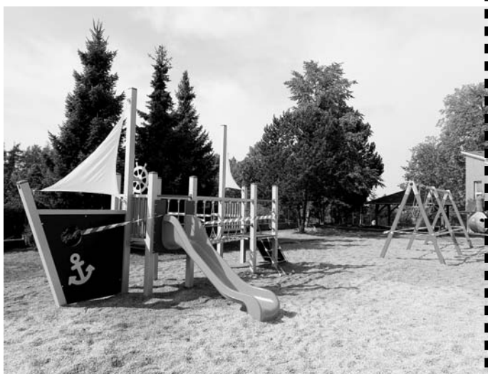
♦ V srpnu byly rovněž obnoveny herní prvky v zahradě mateřské školy. Ty staré byly již nebezpečné a neprošly pravidelnou bezpečnostní kontrolou.