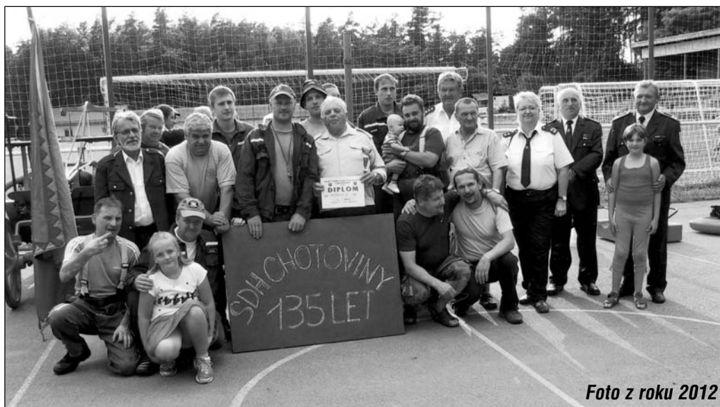
Foto z roku 2012