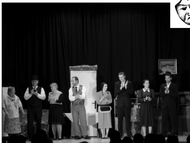
Dne 24. 11. 2017 nám přijel zahrát spolek divadelních ochotníků při TJ Sokol Miličín do KD komedii ZÁZRAČNÝ PANÁK.