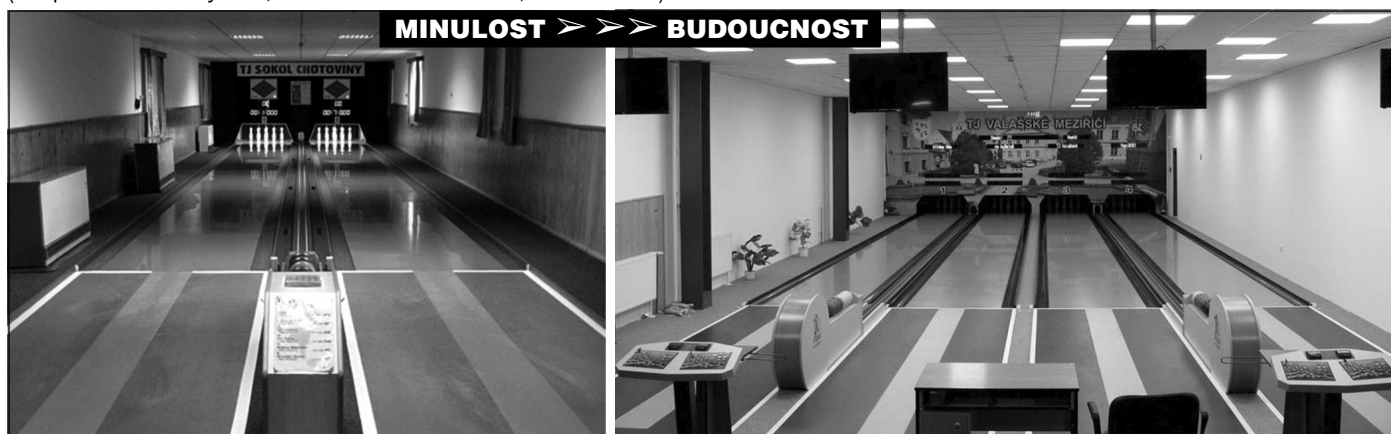
MINULOST >>> BUDOUCNOST

POZOR! Z důvodu výše uvedených skutečností nebude v srpnu, v rámci Chotovinských slavností, otevřena kuželna pro veřejnost.