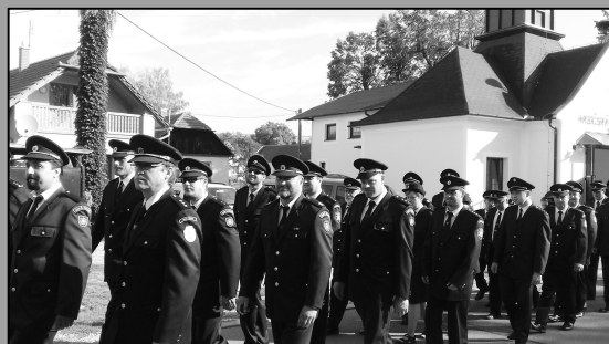
Na návštěvě v Buchlovicích