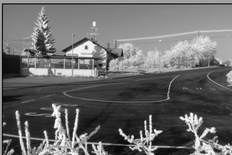
Autobusová točna u nádraží