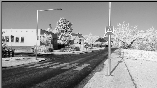
Nové chodníky a přechod pro chodce ve středu Chotovin