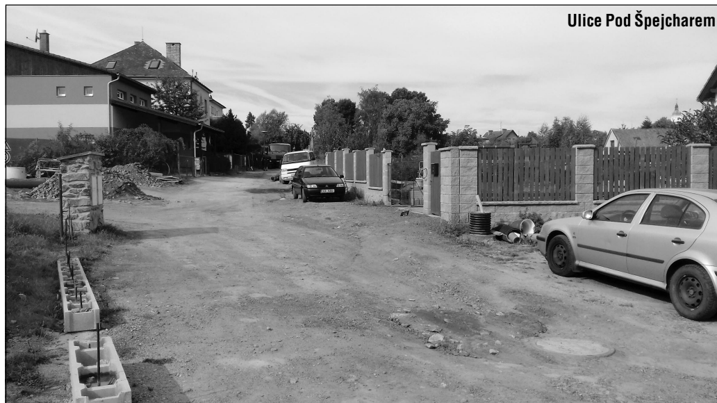
Ulice Pod Špejcharem