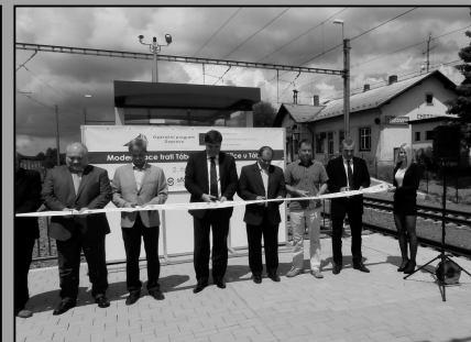
Otevření železničního koridoru