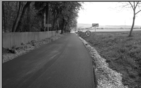
Oprava komunikace na Polánku