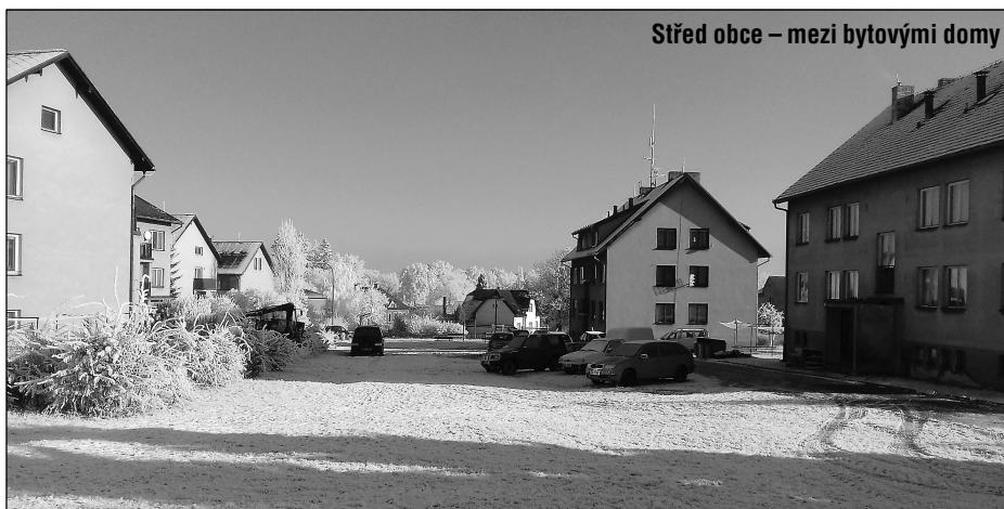
Střed obce – mezi bytovými domy

Naplánované výdaje vyjadřují nejdůležitější potřeby a zajistí jak běžný provoz, tak i rozvoj obce.