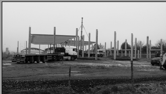
Výstavba konzervárny v průmyslové zóně