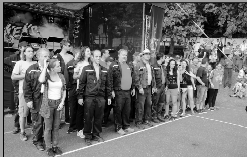
Chotovinské slavnosti 2016