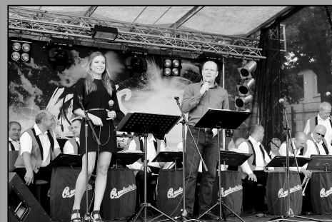
Chotovinské slavnosti 2016