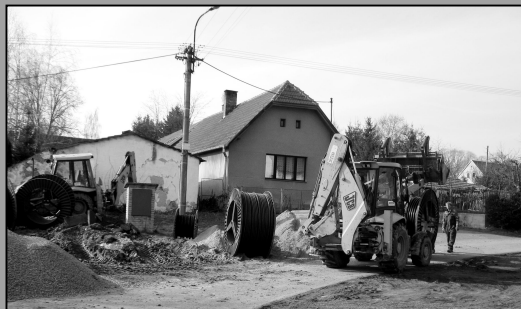
Rekonstrukce veřejného osvětlení v Revnově

Obnova vstupu do KD Chotoviny – tento dotační titul vyžaduje spoluúčast minimálně čtyř obcí. Připojí se partnerské obce: Nemyšl, Jedlany a Sudoměřice u Tábora. Předpokládané náklady 700 000 Kč, dotace max. 60 % /pokračování na str. 5/