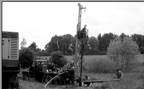
Hledání nových zdrojů vody