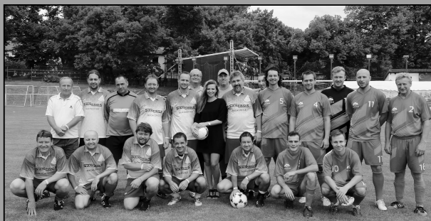
Chotovinské slavnosti 2016