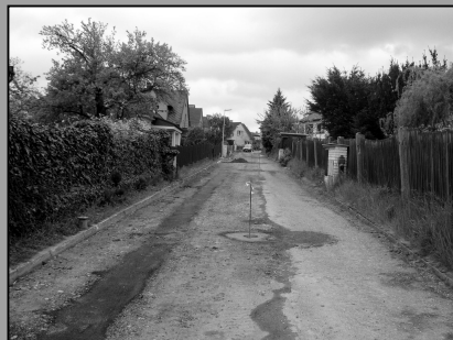
Oprava komunikace v ulici Ovocná