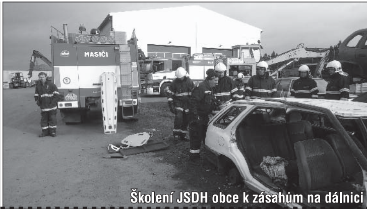
Školení JSDH obce k zásahům na dálnici