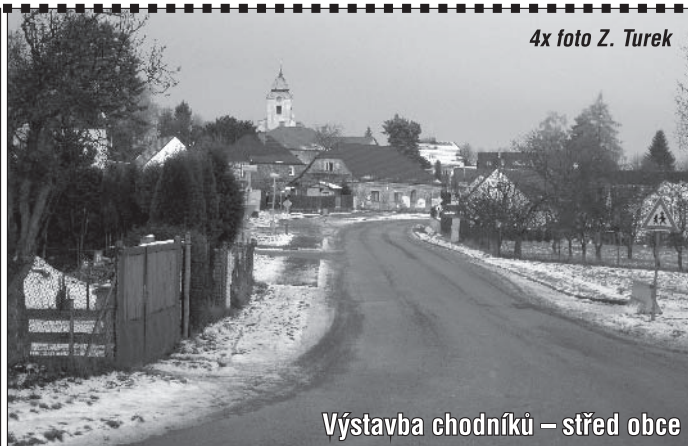
Výstavba chodníků – střed obce