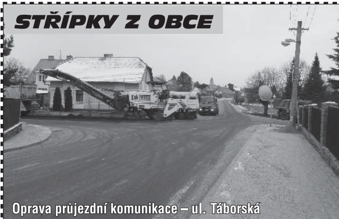
Oprava průjezdní komunikace – ul. Tábořská