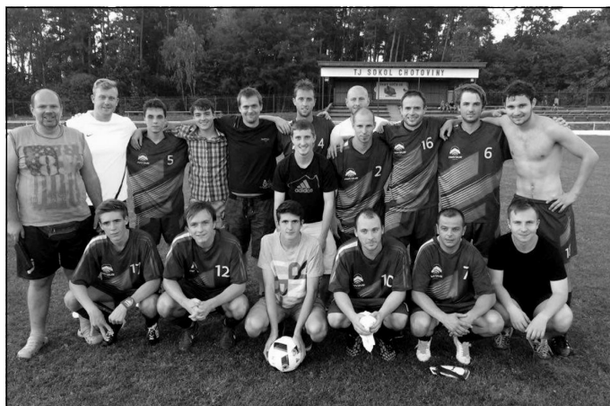
Vítězná sestava po zápase s Borotínem (11 : 1)

Na domácí půdě si Chotoviny hodně věří. To znovu potvrdily v zápase proti Choustníku. Začátek zápasu se nesl v duchu mnoha šancí, diváci se dobře bavili. Ze všech šancí však v síti skončil pouhý jeden gól, domácí se ale ještě před koncem poločasu dokázali prosadit znovu. Po změně stran přibyl další gól, který znamenal pohodové vítězství. Soupeř už stačil pouze korigovat výsle-