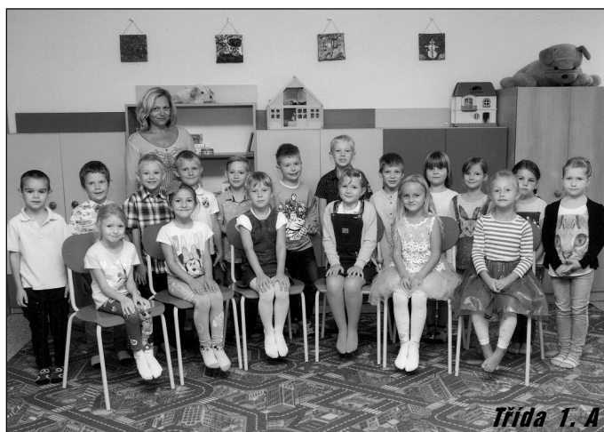
Třída 1. A

Novinkou letošního školního roku jsou dva nové školní kluby. Díky projektu Šablony II, který jsme v září rozběhli, můžeme podporovat čtenářskou i matematickou gramotnost. Od září tak mohou všichni žáci navštěvovat Čtenářský klub a Klub na rozvoj logiky a deskových her. Pro lepší orientaci na trhu práce, zvláště pak na pomoc s vý-