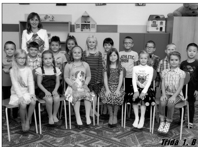
Třída 1. B

běrem střední školy či učebního oboru, působí u nás kariérní poradce, u kterého žáci i jejich rodiče najdou cenné rady. Úzce spolupracujeme rovněž se Střední školou spojující informatiku v Táboře. Naši osmáci a devátáci tuto školu jednak mohou pravidelně navštěvovat během projektových dnů, zároveň však tato škola u nás zajišťuje pro starší žáky kroužek elektrotechniky.